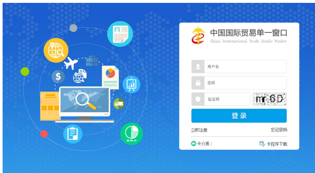
图 “单一窗口”标准版登录

在图“单一窗口”标准版登录中输入已注册成功的用户名、密码与验证码，点击登录按钮。根据各地区提供的入口，进入享受受阻协调申请系统的界面。点击右上角“退出”