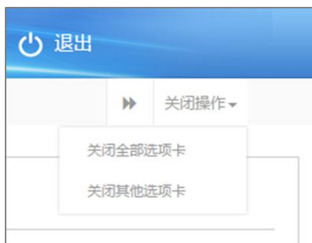
图 关闭选项卡操作