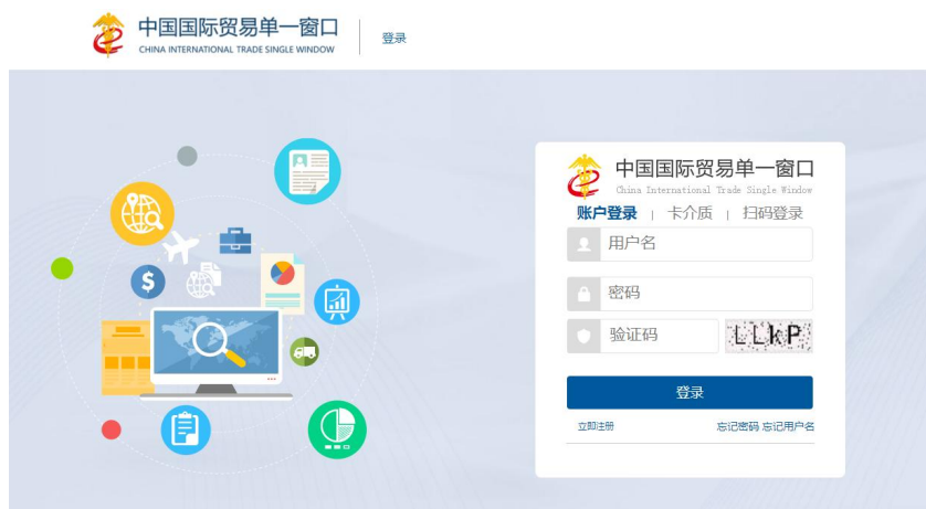
图 “单一窗口” 登录界面

在图“单一窗口”登录界面中输入已注册成功的用户名、密码与验证码或选择卡介质输入中国电子口岸卡介质密码，点击【登录】按钮，登录系统后，点击右上角“退出”字样，可安全退出系统。